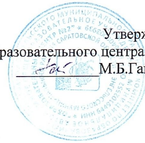
График дежурства в столовой в МАОУ «Образовательный центр № 2» 2 полугодие 2023-2024 учебного года.